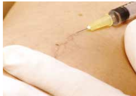
Gestautes Blut im Besenreiser wird verdrängt

Falls Sie Beschwerden im behandelten Bein verspüren oder eine Schwellung des Beines auftreten sollte, muss umgehend durch uns oder Ihren Hausarzt eine Beinvenenthrombose ausgeschlossen werden.