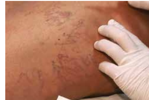
Vor der Mikro-Sklerotherapie von Besenreisern