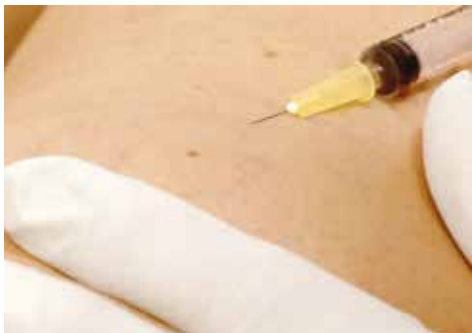
Besenreiser veröden mit der Mikro-Sklerotherapie