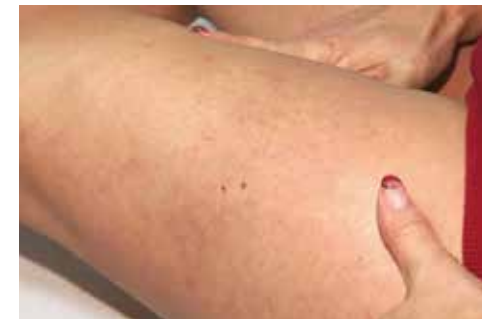
Nach der Mikro-Sklerotherapie von Besenreisern